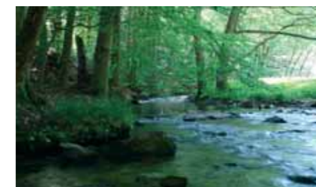
Urff „Hoher Keller“