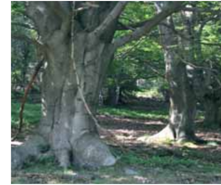
Hutewald bei Gellershausen