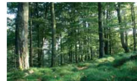
Buchenwald am Wüstegarten

des naturnahen Mittelgebirgsbaches und seiner Aue mit stabilen Beständen typischer Arten als Nahrungsraum für Schwarzstorch und Eisvogel. Dazu sind Querverbauungen zu beseitigen und die natürliche Dynamik zu fördern. Fischteiche sind zu renaturieren und Feuchtwälder zu regenerieren. Am Orthberg mit Wanderklippe sind naturnahe Buchen- und Laubmischwälder mit hohem Alt- und Totholzanteil über naturschutzoptimierte Waldbewirtschaftung und Prozessschutz zu erhalten. Nadelholzforsten sollen behutsam in Laubwaldgesellschaften umgewandelt werden.