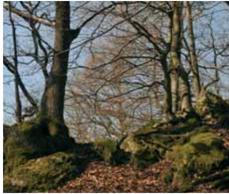
Felswald am Orthberg