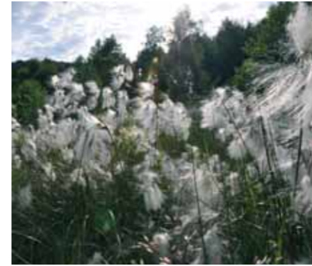
Wollgras im Kellerwaldmoor