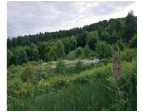
Kellerwaldmoor „Hoher Keller“

mittleren und südlichen Kellerwaldes. Hier sind ergänzend anspruchsvolle, teils geophytenreiche Waldmeister-Buchenwälder verbreitet. Im Durchbruch des mittleren Urfftales treten über Kalkgestein kleinflächig sogar Orchideen- und Platterbsen-Buchenwälder auf. Die Talschlucht ist durch ihren naturnahen Bachlauf und ihre Bachauenwälder gekennzeichnet.