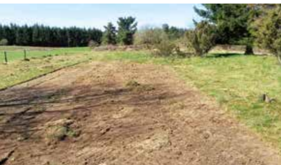
„Plaggenfläche“ auf dem Mittelberg