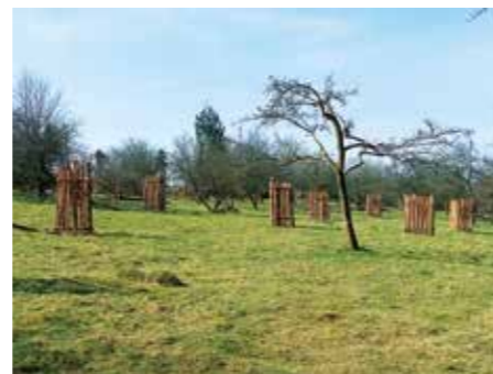
Pflanzung alter Obstbaumsorten

ten wurden durch den Forstbetrieb Heer im großen Umfang Fichten bodenschonend entnommen. Schlagabraum und Fichtenverjüngung wurden anschließend mit einem Hacker weiterverarbeitet. Zur Schonung der Auenbereiche und vereinzelt vorkommenden Kalktuffquellen musste das Häckselgut abtransportiert werden.