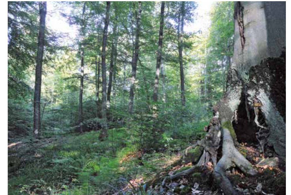
Strukturreicher Buchenwald wird unter Prozessschutz gestellt

Der Bereich „Neugesäß“ im Hohen Keller ist mit seinen geschlossenen naturnahen Buchenwäldern ein besonders wertvoller Lebensraum für seltene Tier- und Pflanzenarten wie Bechsteinfledermaus und Schwarzstorch oder die gefährdete Schwarzweiße Zeichenflechte. Ziel der Maßnahmen in diesem Kernbereich ist es, den Wald mit seinem hohen Alt- und Totholzanteil als Garant für biologische Vielfalt zu erhalten. In Abstimmung mit der Domänialverwaltung und dem zuständigen Revierförster wurde nun eine 14,5 ha große Prozessschutzfläche abgegrenzt, auf der natürlich-dynamische Prozesse ganz ohne störende Eingriffe ablaufen können.