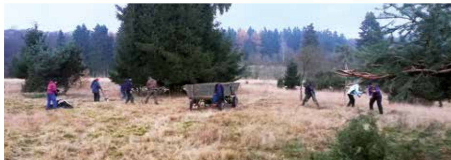
Plaggenhieb am Fahrentriesch

Das Bergwaldprojekt war wie jedes Jahr im Buchen-Nationalpark zu Besuch. Freiwillige aus ganz Deutschland führten zwischen dem 23. und 29. November verschiedene Pflegearbeiten zur Erhaltung der Kulturlandschaft am Fahrentriesch