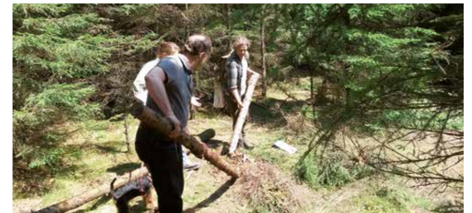
Einrichtung des Moorpfades in mühevoller Handarbeit

Im Rahmen der Besucherlenkung wird zur Zeit ein Moorpfad angelegt. Dies war Anlass kleinflächig entsprechende biotopoptimierende Maßnahmen durchzuführen. Fichtenstangenholz wurde gefällt, teilweise entastet und außerhalb der sensiblen Moorbereiche und Feuchtwälder abgelagert. Bei den Arbeiten wurden neue Moorbirkenstandorte lokalisiert und gesichert. Für die Gäste ergeben sich freie Sichtachsen ins Moor mit neuen Perspektiven. Rundhölzer und Baumstämme werden zukünftig den Weg durchs Moor weisen. In einem letzten Arbeitsschritt sollen noch einzelne Nadelbäume außerhalb der Vegetationsperiode entnommen werden.