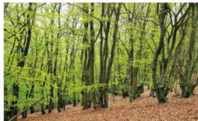
Niederwälder gelten als primitivste Form planmäßiger Holznutzung. In Nordhessen dienten sie fast ausschließlich der Brennholzversorgung (Hutekuppenlandschaft bei Gellershausen).

Scheitholz ist traditionell die regenerative Brennstoffform, aus der die meiste Energie zur Wärmeerzeugung gewonnen wird. Im ländlichen Raum ist eine nachhaltige Belieferung aus ortsnahen Wäldern wieder zu einem wichtigen Faktor geworden. Auch auf historische Waldnutzungsformen nimmt der Druck zu, einen Beitrag zur Scheitholzbereitstellung zu leisten. Für den im Rahmen der nationalen Strategie zur biologischen Vielfalt angestrebten grenzübergreifenden Biotopverbund spielen die reliktschen, kulturhistorischen Waldwirtschaftsformen neben den Prozessschutz-Wäldern und neuen Wildnisgebieten eine große Rolle als Kernflächen. Insbesondere in ehemaligen Hutewäldern ist der Totholzanteil im Gegensatz zu den Wirtschaftswäldern hoch und stark dimensioniert, so dass sie Ausbreitungszentren für gefährdete Höhlen- und Totholzbewohner sein können.