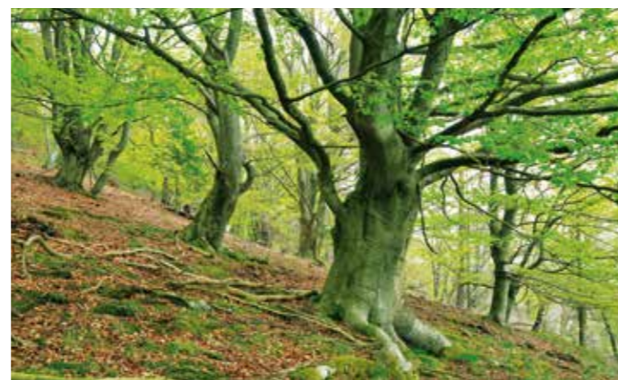
Die Hutewälder Nordhessens sind Zeugnisse früherer Waldweide (Hutekuppenlandschaft bei Gellershausen).

Eine Studie von cognitio im Rahmen der naturkraft-region und im Auftrag des Naturparks Kellerwald-Edersee, gefördert vom BMELV, beleuchtet am Beispiel der Hutekuppenlandschaft bei Edertal-Gellershausen, ob eine Scheitholznutzung historischer Waldnutzungsformen unter dem Primat biologischer Vielfalt möglich ist. Das Untersuchungsgebiet soll zu einem ökologisch hochwertigen Funktionsraum und zu einer Erlebnislandschaft revitalisiert werden, als eine Pufferzone zwischen der werdenden Wildnis des Nationalparks Kellerwald-Edersee und der Kulturlandschaft. In Kooperation mit der Bevölkerung sollen nachhaltige Nutzungsformen erprobt werden. Die Ergebnisse der Studie ergänzen den Umfang des Naturschutzgroßprojektes und vernetzen es über seine Grenzen hinaus.