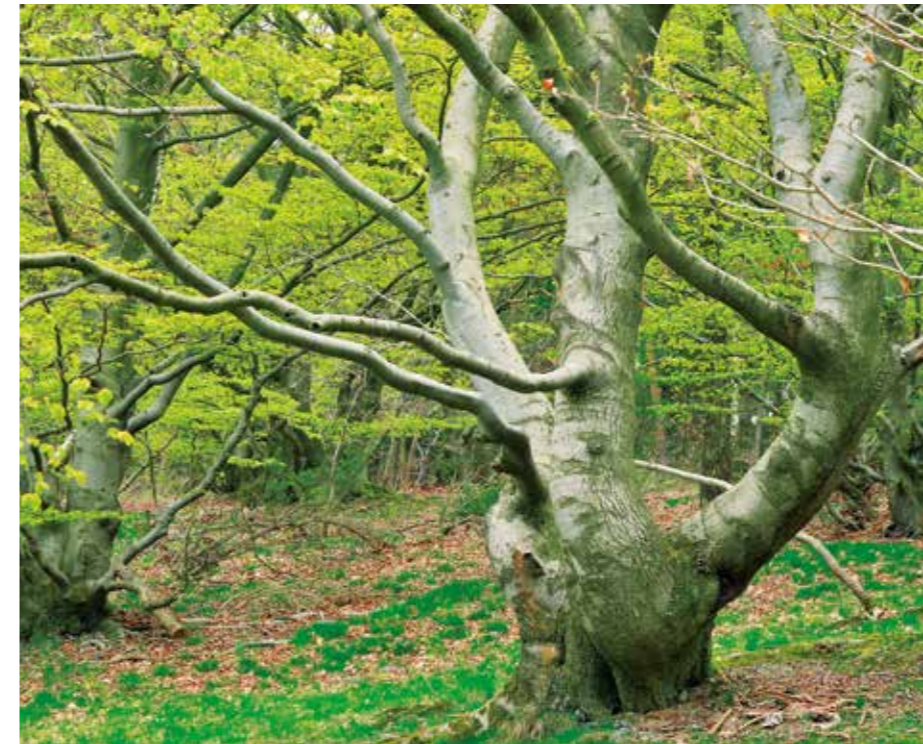
Eine Mischnutzung als Hute und zur Brennholzgewinnung hat zu skurrilen Waldformen geführt (Hutekuppenlandschaft bei Gellershausen).

Nieder- und Mittelwälder bauen in den ersten Jahrzehnten eine größere Biomasse auf als Hochwälder, während der Gesamtertrag über 120 Jahre in Hochwäldern höher ist. Allein aus Produktionsaspekten erscheint daher eine Rückkehr zur Mittel- und Niederwaldwirtschaft nicht gerechtfertigt. Aus forstlicher Sicht stehen bei der Niederwaldwirtschaft zudem minderwertige schwache Holzsortimente hohen Werbungskosten gegenüber. Für Selbstwerber ist die historische Nutzung dagegen interessant. Maßgeblich sind eine im Vergleich zur Hochwaldnutzung relativ einfache Ernte und kurze Produktionszeiträume, die gut geregelt werden können. Hinzu kommt die motivierende Win-win-Situation mit Naturschutz, Klimaschutz und Landschaftspflege. Im Falle von Revitalisierungen sind allerdings die kulturhistorischen Waldnutzungsformen zu differenzieren. Gerade alte Hutewälder zeigen