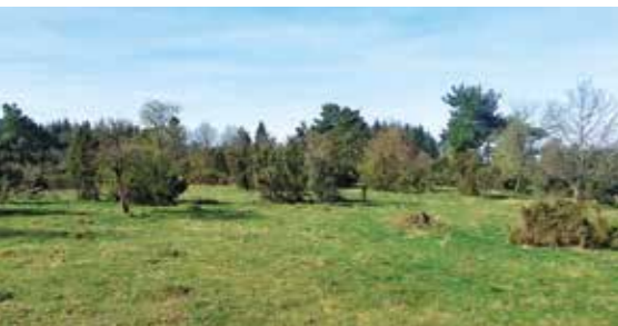
Halboffene Weidelandschaft FFH-Gebiet Mittelberg

In dem FFH-Gebiet „Magerrasen am Mittelberg bei Frankenau“ wurden zum zweiten Mal die wertvollen Heidenelken-Rasen, Borstgrasrasen und Zwergstrauchheiden freigestellt. Weitere Nadelbäume und Gehölze wurden zur Fällung gekennzeichnet. Der ortsansässige Forstbetrieb Erwin Öhl fällt das stärkere Baumholz. Das Schwachholz wurde bodenschonend unter Einsatz eines Rückepferdes des Archehofes Kellerwald abtransportiert. Auf einer 200 m 2 großen Fläche kam ein Rasensoden-Schneider zum Einsatz, der die verfilzte Grasnarbe vom Untergrund löste. Der Standort wird so „ausgehagert“. Seltene Rohbodenpioniere werden begünstigt. Eine direkt anschließende Beweidung durch Pferde, Rinder und Schafe steuert die weitere Entwicklung des Schutzgebietes.