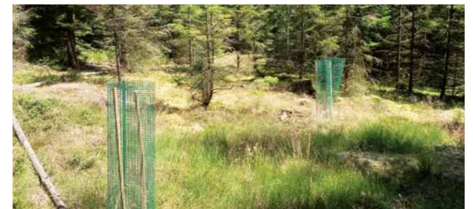
Sicherung der neu lokalisierten Moorbirkenstandorte