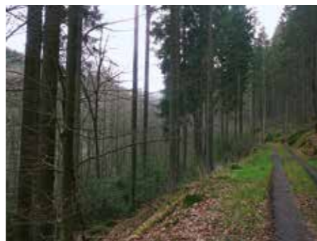
Der Nadelforst im Urfftal

Neben der Förderung einer natürlichen Bachdynamik steht im Maßnahmenraum Urfftal die Entwicklung naturnaher Wälder ganz oben auf der Agenda des Naturschutzgroßprojektes. Im Interessentenwald Schiffelborn werden ehemals gepflanzte Nadelholzforsten behutsam umgewandelt. In Abstimmung mit den Waldinteressen-