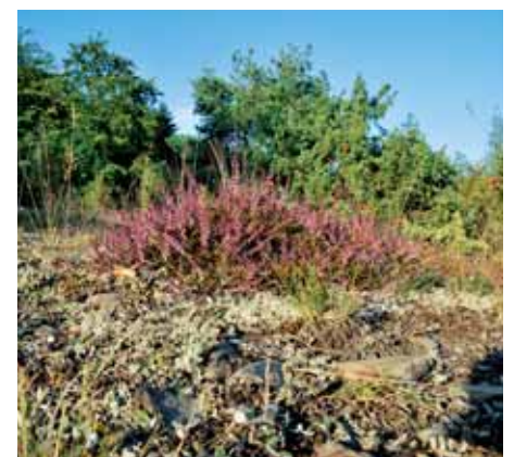
Im Winter 2009/2010 wurde an der Koppe bei Altenlotheim der Magerrasenanteil durch Herausnahme von Bäumen und Sträuchern nahezu verdoppelt. Eine Beweidung mit Schafen sorgt dafür, dass die Verbuschung nicht wieder aufkommt. Als Ergebnis breiten sich zunehmend wärmeliebende Kräuter und Flechten aus.