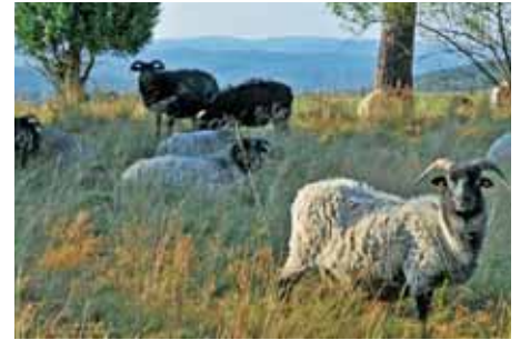
Heidschnucken am Mittelberg

Hof“ der Gesellschaft zur Erhaltung alter und gefährdeter Nutztierassen e. V. (GEH) auf und überträgt sie auf eine ganze Region. Auf modellhafte Art und Weise werden Landschaftssicherung, naturschutzgemäße Bewirtschaftung, Erhaltung alter Haustierrassen, Naturtourismus und Umweltbildung vereint.