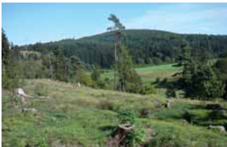
Maßnahme an der Struthmühle

Auch am Mittelberg und an der Struthmühle gibt es sie noch – wertvolle Heidenelken-Rasen, Rot-Straußgras-Weiden, Borstgrasrasen und Zwergstrauchheiden. Größere Anteile der ehemaligen Huteflächen wurden allerdings mit Nadelgehölzen bepflanzt. Um sie zu regenerieren und zu erweitern, werden Fichten, Kiefern und Douglasien entnommen. Nur markante