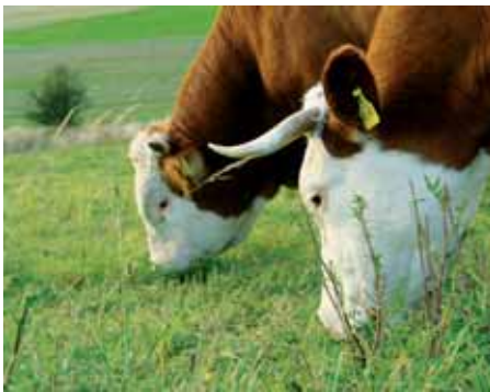
Hinterwälder Rinder im Weidengrund