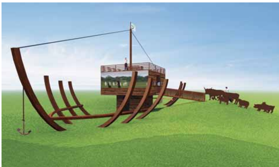
3D-Modell des Arche-Schiffs (cognitio)

Erlebnis-Kulisse der „Kultur-Arche“ ist ein großer Schiffsrumpf. Zentraler Informationspunkt ist ein Würfel, der im Gesamtkontext des Schiffes die Aufbauten mit Kommandobrücke und Ausguck darstellt. Der Infowürfel ist über eine Rampe vom „Land“ aus begehbar. Nutztiere als Anschauungs- und Spielobjekte weisen den Weg in die Arche und schauen aus Bullaugen. „Stallboxen“ und „Hühnerstangen“ mit Tafeln, interaktiven Elementen wie Klappen und Schiebern mit Toninstallationen informieren über regionale Nutztiere, über Rassenvielfalt, Geschichte und Gefährdung. Die Nutztierinformationen leiten zur Kulturlandschaft über, die in ihrer regionalen Vielfalt mit ihren typischen Tier- und Pflanzenarten über attraktive Interaktionen erfahren werden können. Die Kulisse wird zum Medium, zum Einstieg in naturkundliche Themen mit hohem Aufforderungsgrad. Vom Ausguck schweift der Blick über einen zentralen Teil der Arche-Region, dem Weidengrund, bis in das Waldmeer des Nationalparks und in die Ferne.