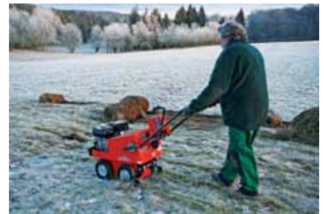
Mit einem Rasensodenschneider wurde die Pflanzendecke abgetragen.

Untergrund. Die Bahnen wurden anschließend in Soden aufgerollt und diese von einem ortsansässigen Landwirt mit einem Miststreuer auf einem nahen Acker ausgebracht.