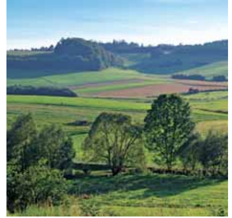
Das Lorfetal vernetzt die Kulturlandschaftselemente von Altenlotheim und Frankenua.

dehnung der Arche-Region Frankenua im Sinne einer nachhaltigen wirtschaftlichen und ideellen Etablierung über die Grenzen der prioritären Maßnahmenräume hinaus. Vorrangig geht es um eine Einbindung des Lorfetales zwischen Frankenua und Altenlotheim, das bisher aufgrund begrenzter finanzieller Mittel nicht prioritär eingebunden werden konnte. Maßnahmen zur Erhaltung der Lebensräume sollen gefördert werden. Ein Infoweg soll zukünftig durch die Arche-Landschaft bei Frankenua mit der Heidelandschaft von Altenlotheim leiten.